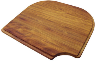
Schneidebrett aus Iroko-Holz 8659 111