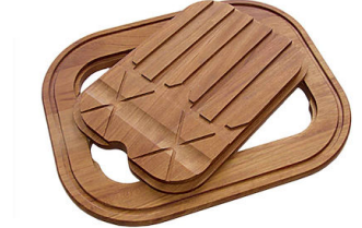
Schneidebrett Twin aus Iroko-Holz 8644 003