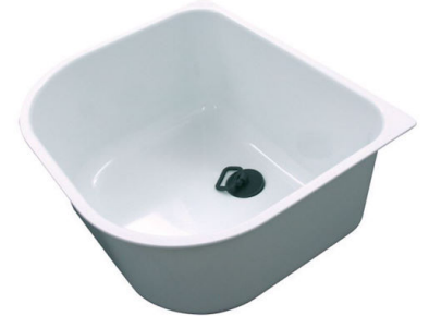
Weiße Wanne 8152 100