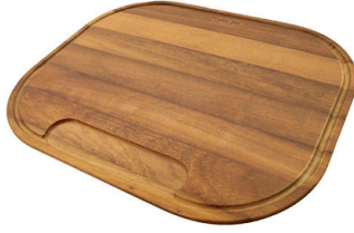
Schneidebrett aus Iroko-Holz 8659 112