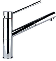
Mischbatterie Lorenzo 8466 000